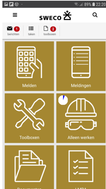
Alleen Werken staat aan (VeiligSweco app)